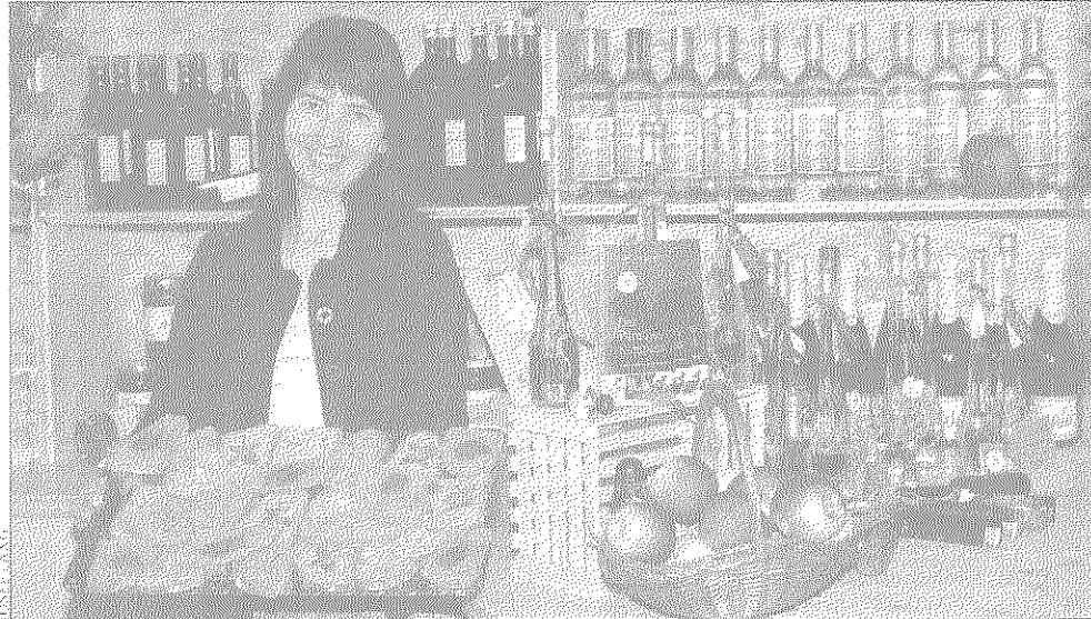
Die 30 Mitgliedsbetriebe laden zu Gaumenfreuden aus Küche, Keller oder Obstgarten ein

SÜSSE VERSUCHUNG In der Pralinenmanufaktur Spiegel in Bad Tatzmannsdorf bekommen Interessierte Einblick ins Pralinenatelier und können den Beschäftigten bei der Produktion über die Schulterschauen. Für die Verkostung am Schokoladenbrunnen werden paradisiische Cocktails aus dem Kakaoprodukt gezaubert. Auch